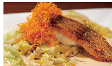
本日魚のポワレ 白菜のクリーム煮 ¥1,720 Poire of today's fish with creamed Chinese cabbage