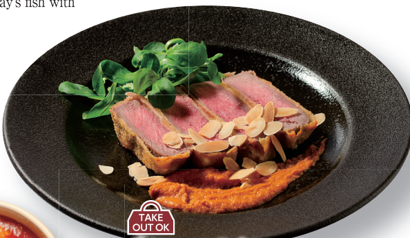
TAKE OUT OK 牛ロースのカツレツ アーモンド風味のトマトソース ¥2,400 Beef cutlet with almond flavor tomato sauce