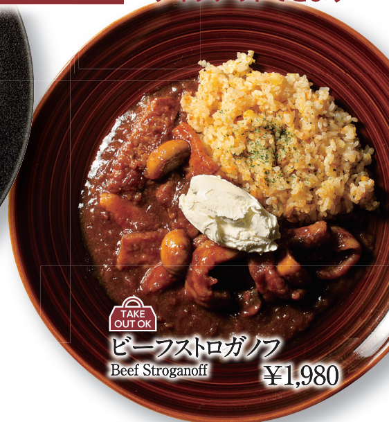
TAKE OUT OK ビーフストロガノフ Beef Stroganoff ¥1,980