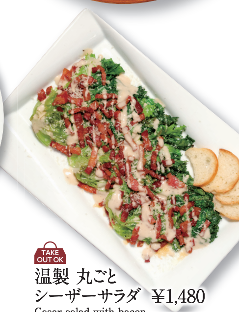
TAKE OUT OK 温製 丸ごと シーザーサラダ ¥1,480 Cesar salad with bacon