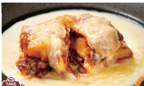
TAKE OUT OK チーズたっぷりミートラザニア Meat lasagna with lots of cheese on top ¥1,700