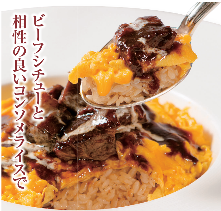
TAKE OUT OK ●当店おすすめ! ビーフシチューオムライス Beef stew omelette rice ¥1,820