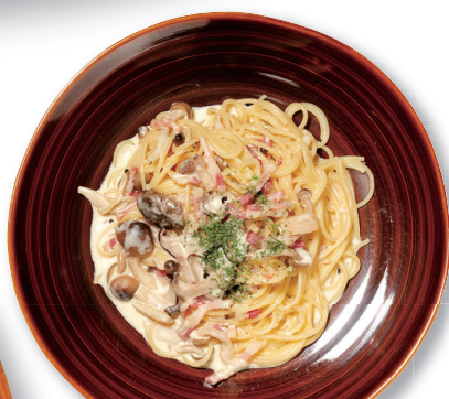
パンチェッタとキノコ ¥1,360 トマト / クリーム / ペペロンチーノ Pancetta and mushrooms [tomato sauce / cream sauce / peperoncino]