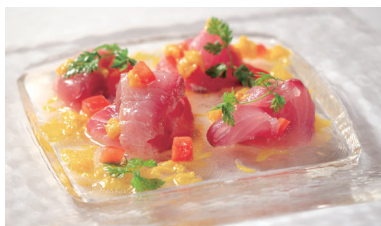
本日魚のカルパッチョ ¥1,300 信州リンゴドレッシング Carpaccio of Today's fish with apple dressing