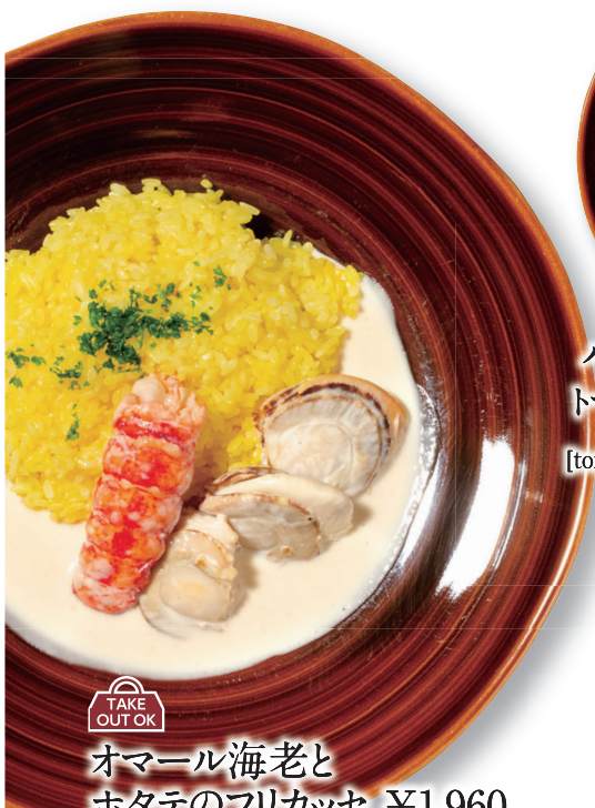
TAKE OUT OK オマール海老と ホタテのフリカッセ ¥1,960 Lobster fricassee with saffron rice