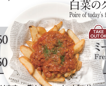
TAKE OUT OK ミート&ポテト ¥800 French fries with meat sauce