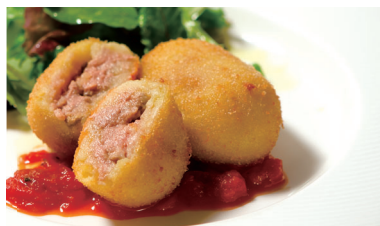
フォアグラのコロッケ ¥1,680 Croquette of foie gras