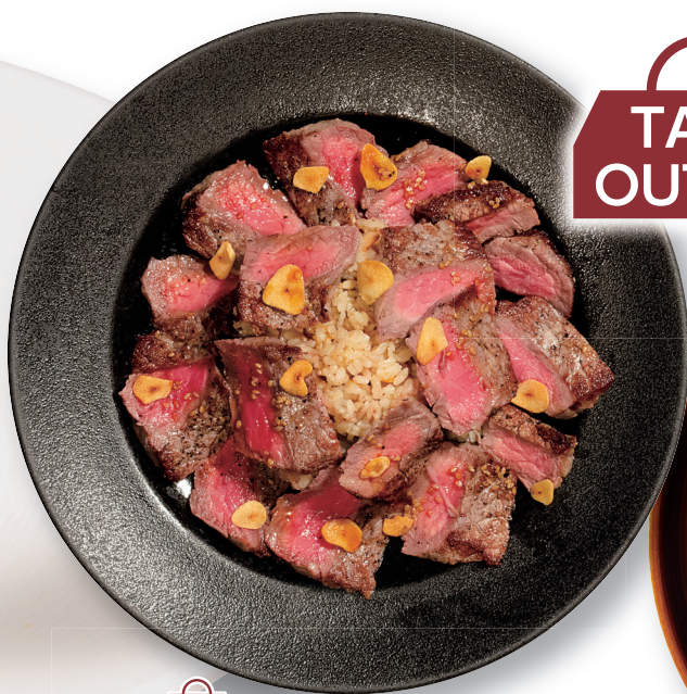
TAKE OUT OK ステーキガーリックピラフ Steak strips with garlic rice ¥1,360 肉100g増量 ¥1,960 additional 100g